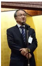
池崎前会長（相談役） 花束贈呈